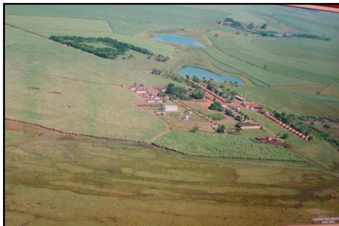
Foto aérea da fazenda